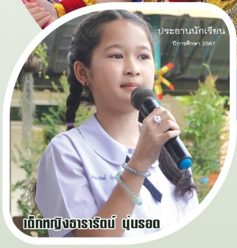
ประธานนักเรียน ปีการศึกษา 2567