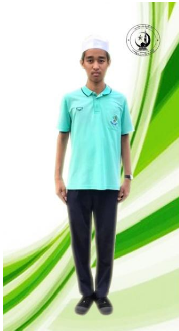
ชุดกีฬาผู้ชาย