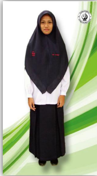
นักเรียนหญิง