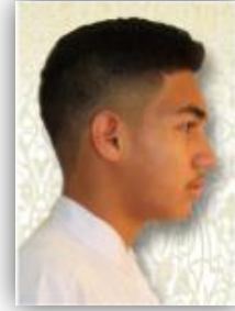
ด้านข้าง