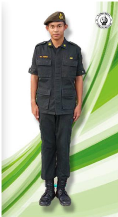
นักศึกษาวิชาทหารชาย