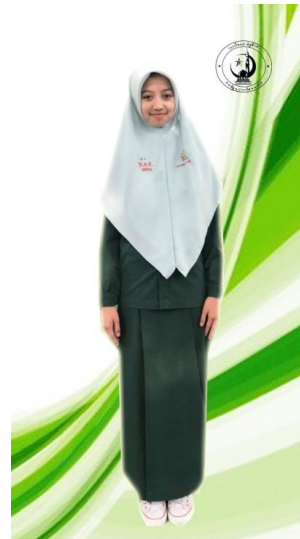
เนตรนารีสามัญรุ่นใหญ่