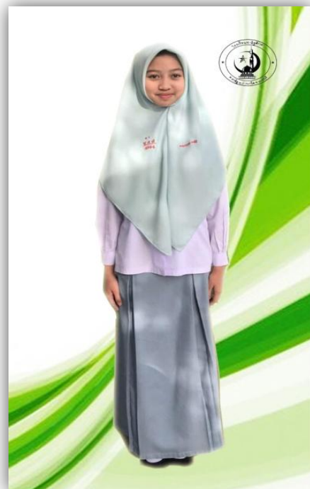
นักเรียนหญิง