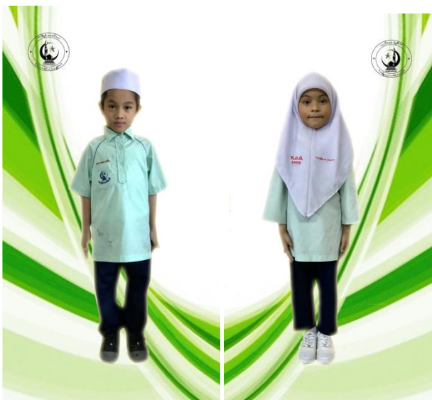
ชุดพลະชาย