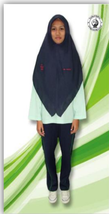
ชุดพลະหญิง