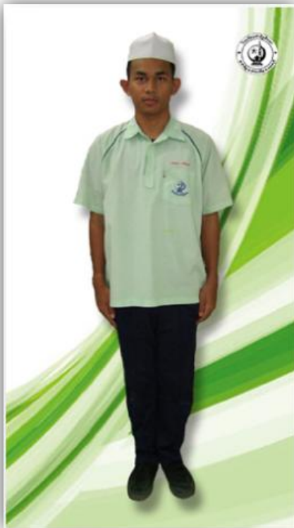
ชุดพลະชาย