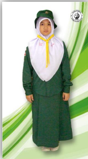
เนตรนารีสามัญ ป.4 - ป.6