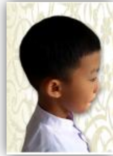
ด้านข้าง