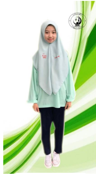
ชุดพลະหญิง