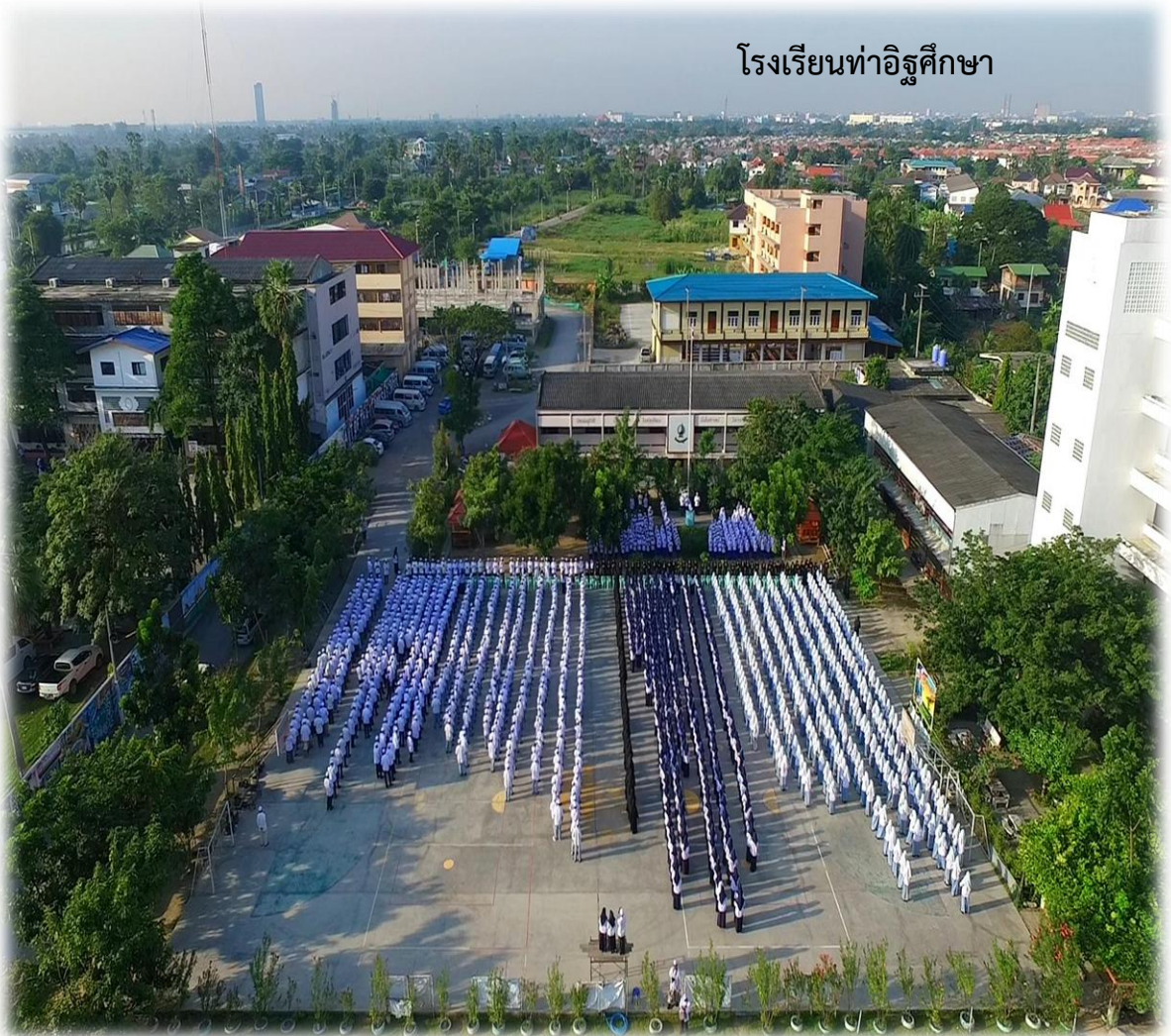
โรงเรียนทำอิฐศึกษา

โรงเรียนทำอิฐศึกษาเป็นสถาบันการศึกษาจัดตั้งขึ้นตามเจตนารมณ์ของมูลนิธิ ทำอิฐศึกษา โดยโรงเรียนทำอิฐศึกษา มุ่งมั่นพัฒนานักเรียนให้มีความรู้คู่คุณธรรมในศาสตร์ต่างๆ สามารถศึกษาต่อได้ในระดับที่สูงขึ้น เป็นผู้มีคุณธรรมและความประพฤติดีงามตามกรอบของ ศาสนาอิสลาม เพื่อให้มีความสุขทั้งโลกนี้และโลกหน้า จัดกิจกรรมที่เน้นผู้เรียนเป็นสำคัญ การมี ส่วนร่วมระหว่างโรงเรียน บ้านและชุมชน คือหัวใจของความสำเร็จอย่างมีคุณภาพ ของนักเรียน และผู้ปกครองย่อมมีส่วนร่วมอันสำคัญยิ่งในความสำเร็จของ นักเรียน ที่ต้องกวาดขันเอาใจใส่ดูแล ให้ความรัก ความอบอุ่น ตลอดจนการประพฤติปฏิบัติตนของผู้ปกครองซึ่งเป็นแบบอย่างที่ดี คู่มือฉบับนี้จัดทำขึ้นเพื่อให้นักเรียนและ ผู้ปกครองได้รับทราบการดำเนินงานของ โรงเรียนในด้านต่างๆ และเป็นแนวทาง ปฏิบัติสำหรับนักเรียนและผู้ปกครอง ได้อย่างถูกต้อง เหมาะสม ขอให้ผู้มีส่วนเกี่ยวข้องอ่าน ทำความเข้าใจ แล้วนำไปปฏิบัติอย่างถูกต้องต่อไป