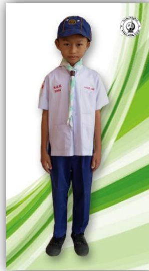
ลูกเสือสำรอง ป.1-ป.3