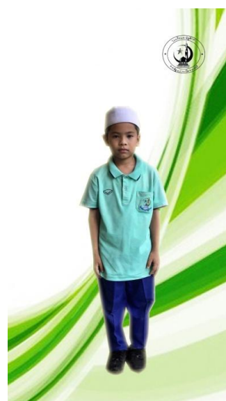
ชุดกีฬาสีชาย