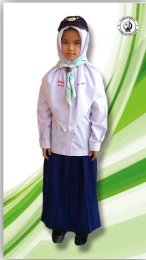
เนตรนารีสำรอง ป.1-ป.3