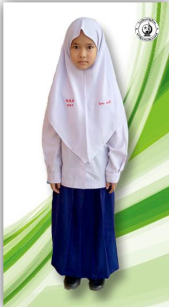
นักเรียนหญิง