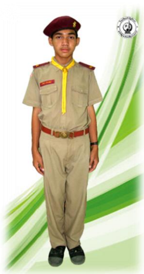
ลูกเสือสามัญรุ่นใหญ่