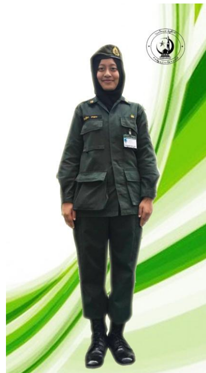
นักศึกษาวิชาทหารหญิง