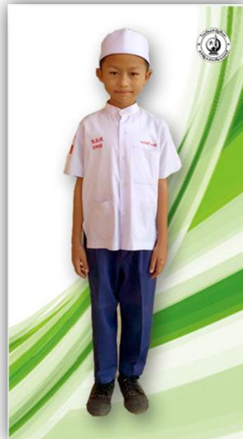
นักเรียนชาย