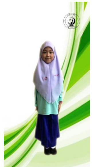
ชุดกีฬาสีหญิง