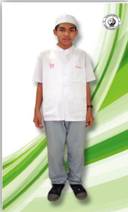
นักเรียนชาย