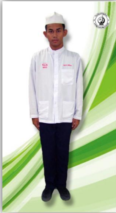
นักเรียนชาย