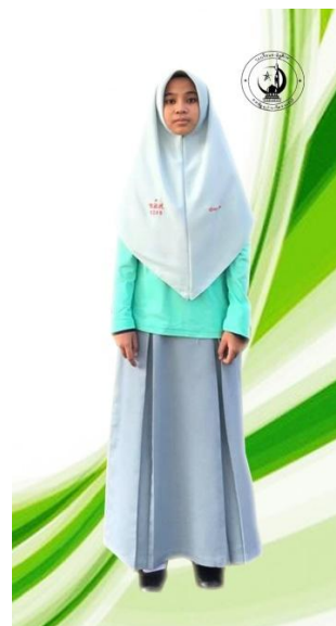
ชุดกีฬาสี่หญิง