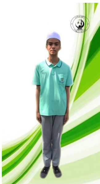
ชุดกีฬาสี่ชาย