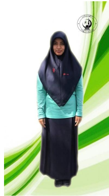
ชุดกีฬาผู้หญิง