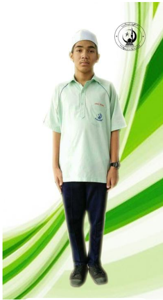
ชุดพลະชาย