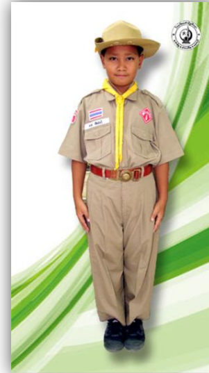
ลูกเสือสามัญ ป.4 - ป.6